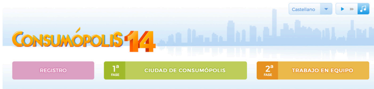
Ilustración 2. Captura de pantalla de diferentes secciones que tiene el concurso.

La página de la ciudad de Consumópolis se abre en la lengua que ha elegido previamente en el portal. Si no se ha seleccionado ningún idioma, por defecto, se abre en castellano. En el caso de que quiera cambiar el idioma en la ciudad de Consumópolis , también puede hacerlo haciendo clic en el desplegable.