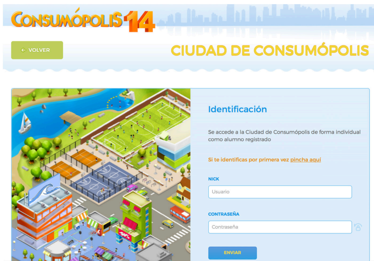
Ilustración 5. Captura de pantalla del acceso e identificación de la plataforma

Se accede a la ciudad virtual de Consumópolis de forma individual, como persona concursante registrada.