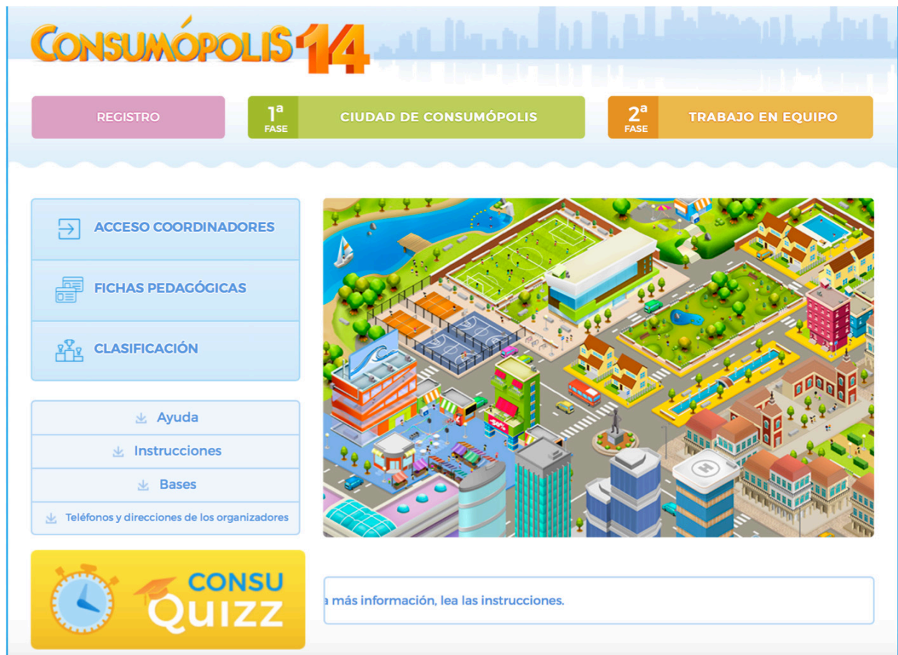
Ilustración 3. Captura de pantalla del concurso de Consumópolis 14

La página principal del concurso consta de las siguientes secciones: Bases; Instrucciones; Teléfonos y direcciones de los organizadores; Acceso coordinadores.